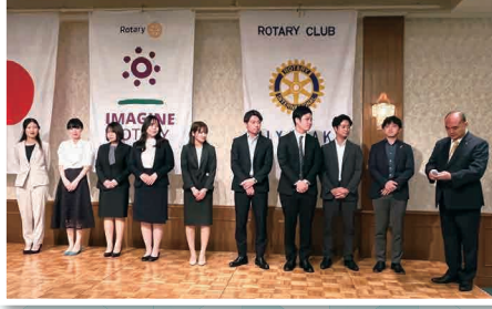
ローターアクトクラブ 参加者の皆様