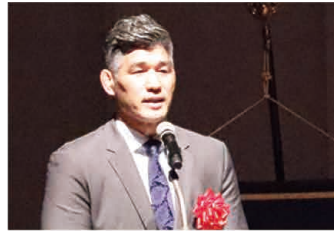
柔道家 井上 康生 氏