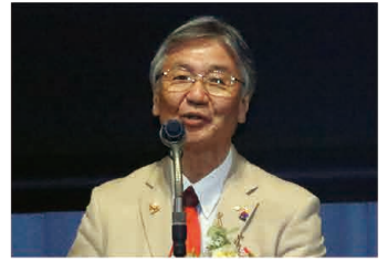
ガバナー挨拶 池ノ上 克ガバナー